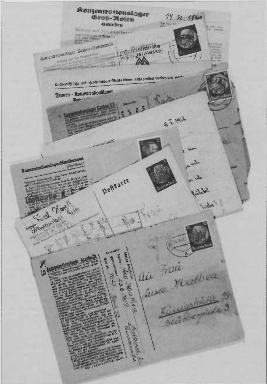
Abb. 2: Briefe auf KZ-Vordrucken mit einer Karte aus dem Ghetto Litzmannstadt, August 1941 bis Juli 1944