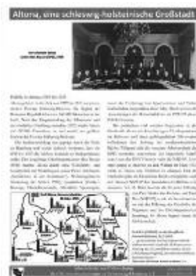
Abb. 6: Eine der Eingangstafeln der Ausstellung mit einem kurzen Überblick zur Altonaer Stadtgeschichte bis 1933

Die Ausstellung beginnt mit einem allgemeinen Überblick zu geschichtsträchtigen Orten in Altona-Altstadt und Altona-Nord, gibt einen Überblick zur Geschichte der »Victoria-Kaserne« und führt in die Nutzungs- und Stadtgeschichte ein. Es folgen fünf Tafeln zur Geschichte der Polizei in Schleswig-Holstein und Altona. Auf ihnen ist das sich wandelnde Verständnis der Aufgaben der Polizei im Laufe des 19. und 20. Jahrhunderts dargestellt, um insbesondere die Unterschiede zur Gegenwart zu vermitteln. Dieser Teil der Ausstellung geht über in eine Darstellung der Aufgaben der Schutzpolizei am Ende der Weimarer Republik (»Kampf um die Straße« und Bürgerkrieg«, »Blutsonntag in Altona«) und einen vier Tafeln umfassenden Schwerpunkt zur Politischen Polizei in der Weimarer Republik und zur Gestapo in der Zeit des Nationalsozialismus. Hier schließen sich zwei Biografien wichtiger Polizeipräsidenten an (Eggerstedt, SPD, und Hinkler, NSDAP).