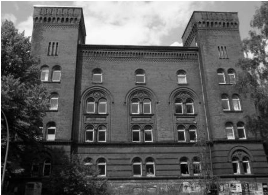
Abb. 1: Das letzte größere Relikt der ehemaligen »Victoria-Kaserne«: der sogenannte »Block III« an der Bodenstedtstraße/Ecke Zeiseweg in Hamburg-Altona.

Auf den vom AKENS konzipierten Ausstellungstafeln wird ein eher unbekanntes Kapitel der Altonaer Stadtgeschichte dargestellt. Sie thematisieren u. a. die Aufgaben von städtischer und staatlicher Polizei, die Biografien einiger Polizeipräsidenten, die Gebäudenutzung, das Wahlverhalten im Stadtteil, den vergessenen Bürgerkrieg 2 Anfang der 1930er-Jahre, den »Altonaer Blutsonntag« vom 17. Juli 1932, politische Polizei und Gestapo, den Übergang in die Hamburger Polizei nach 1937 und die Entnazifizierung nach Kriegsende.