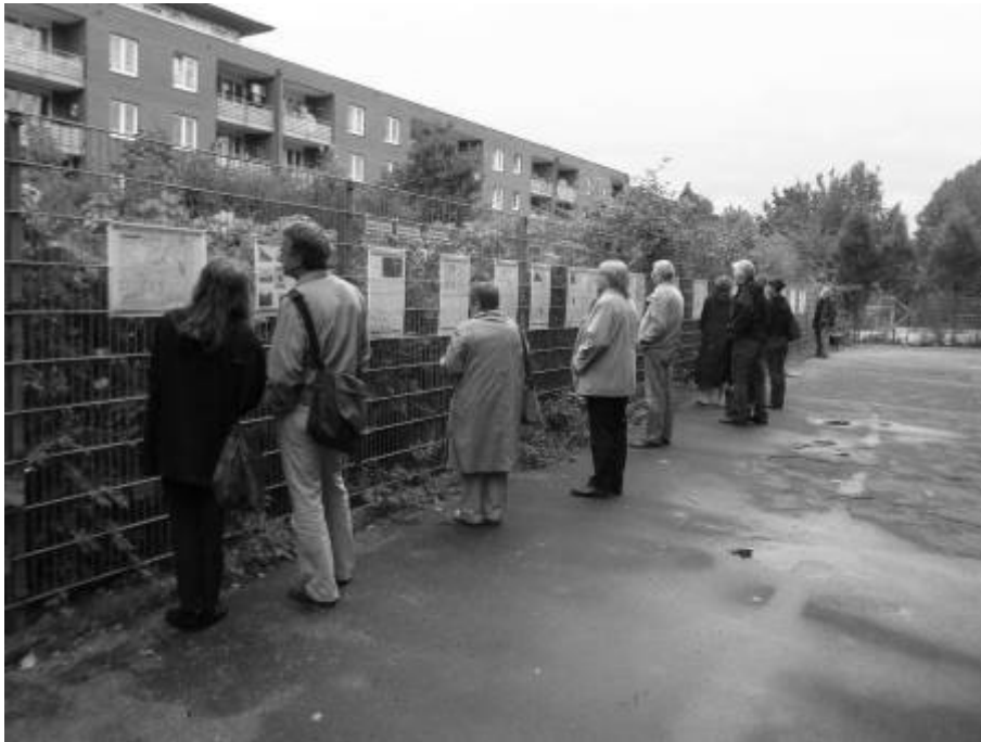
Abb. 8: Besucherinnen und Besucher der Ausstellungseröffnung am 10. September 2011.

gedacht; so litt eine Reihe von Tafeln in den schweren Winterstürmen 2011/12. Dies änderte sich nach dem Vortrag im Februar 2012: Die Hälfte der Ausstellungstafeln wurde Mitte des Monats von Unbekannten zerstört, wobei die Tafeln zur Geschichte der Gestapo und zum Übergang in die Hamburger Polizei nach 1937, auf der auch sehr kurz die Verbrechen im Zweiten Weltkrieg thematisiert werden, erhalten blieben. Seit Mai 2012 sind alle Tafeln wieder zugänglich und die Ausstellung wurde zudem vom 19. März bis 5. April 2012 zusätzlich im Bezirksamt Altona, dem ehemaligen Altonaer Rathaus, als Wanderausstellung präsentiert.