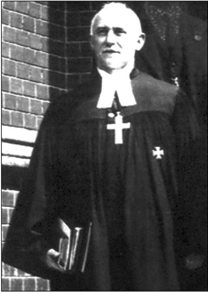
Gustav Dührkop im Talar, 1937