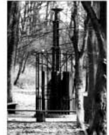
Isarhoer Mahnmahl für die NS-Opfer

Vor 54 Jahren – im Mai 1945 – endete auch in Schleswig-Holstein der Krieg. Als alliierte Soldaten das Land besetzt hatten und die Wehrmacht kapituliert, empfan-