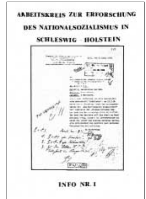
AKENS-Info Nr. 1, September 1983. Auflage: 100 Exemplare

Die strukturellen Schwächen eines landesweiten (mitgliederarmen) Zusammenschlusses zeigten sich 1985 auf dem Arbeitstreffen am 24. März in Kiel: „8. Mai 1985. In diesem Jahr wird in jedem etwas größeren Ort zum 40. Jahrestag der Befreiung vom Faschismus etwas laufen. Diese Projekte wurden kurz vorgestellt. Da alle Mitglieder in irgendeiner Form an diesen Veranstaltungen auf lokaler Ebene beteiligt sind, verzichtet der AKENS auf eine eigene Veranstaltung. Alle Mitglieder werden aber gebeten, Materialien der Vorbereitung wie des Presseechos zu sammeln.“ 13 Da die Mitglieder sich jeweils vor Ort engagierten, hatten sie faktisch nicht auch noch Zeit, sich dort als AKENS-Vertreter zu positionieren, womit die öffentliche Wahrnehmung des Arbeitskreises nicht befördert werden konnte.