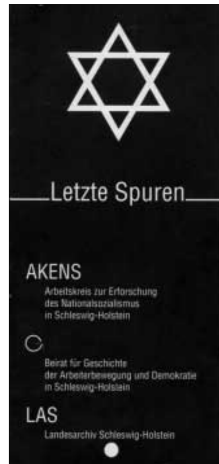
Programmflyer zu Vorträgen anlässlich der Schleswiger Ausstellung Letzte Spuren (September 1994)