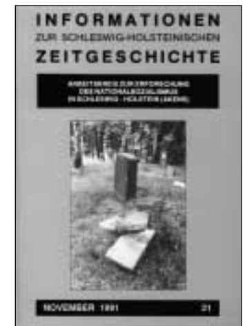
ISHZ Nr. 21, November 1991. Auflage: 500 Exemplare

Die redaktionelle Linie, sich einerseits kleineren, auf regionale Themen ausgerichteten Aufsätzen anzunehmen und auch Laienforschern eine Publikationsmöglichkeit zugeben, andererseits auf bestimmte Standards zu achten und nicht alles abzudrucken, was eingereicht wird, stellt die eigentliche Stärke dar. In der Rückschau zeigt sich, dass ein sehr breites Spektrum an Themen behandelt wurde. 35 Gleichzeitig ist es beeindruckend, wie vielfältig der Aufsatzteil der Zeitschrift nach 20 Jahren ist: Sowohl „harte“ Themen wie Justiz, Entschädigung, Verfolgung oder auch Widerstand sind zu finden; es gab Beiträge