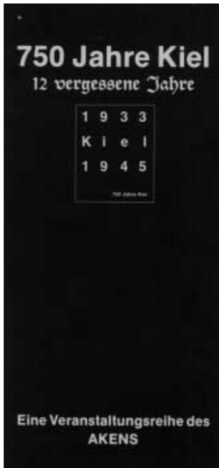
Programmflyer zur Veranstaltungsreihe 12 vergessene Jahre anlässlich des Kieler Stadtjubiläums (Oktober/November 1992)

beschäftigen. Daraus entsprangen fast zwangsläufig Ideen und Kooperationen für den AKENS – davon zeugen die Vortragsreihe angesichts der Ausstellung Letzte Spuren über die Tötungsaktion der SS im Lager Trawniki in Polen im Landesarchiv, die faktische Gegenveranstaltung zum Kieler Stadtjubiläum 750 Jahre Kiel – 12 vergessene Jahre (1992) sowie die Podiumsdiskussion im jüdischen Museum Rendsburg und die Beteiligung an einer Gedenkveranstaltung zu den „Euthanasie“-Opfern in Schleswig (1994). 44