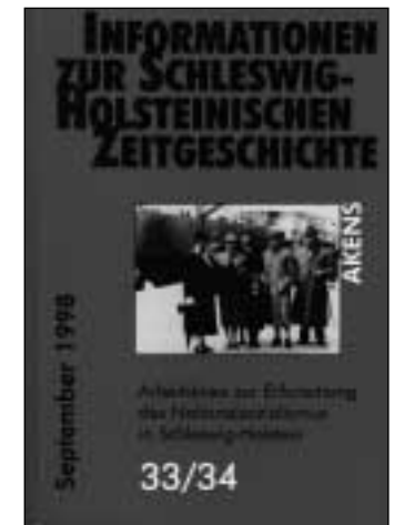
ISHZ Nr. 33/34, September 1998. Auflage: 500 Exemplare