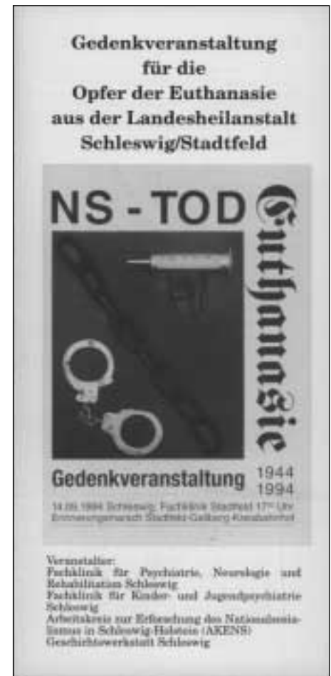
Programmflyer zur „Euthanasie“-Gedenkveranstaltung in Schleswig (September 1994)

Ein weiteres Problem des AKENS besteht darin, dass die ehrenamtliche Personaldecke über die Produktion der Zeitschrift – an der sich eine Reihe von Mitgliedern beteiligt – hinaus sehr dünn ist. Vor diesem Hintergrund ist eigentlich viel erstaunlicher, dass es überhaupt noch zu darüber hinaus-