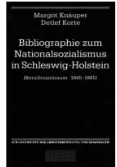
Margot Knäuper/Detlef Korte, Bibliographie zum Nationalsozialismus in Schleswig-Holstein. Kiel 1987

„Aufsehen haben auch die Verhältnisse im Archivwesen des Landes Schleswig-Holstein hervorgerufen, wo Forschungsarbeiten zur NS-Zeit seit Jahren systematisch behindert werden. Nach dem Regierungswechsel vom 31.5.1988 erfolgte eine weitere Zuspitzung. Entgegen den eindeutigen Vorgaben der Ministerin [...] versuchen die Leitung des Landesarchivs und einzelne Kultusbürokraten, die NS-Forschung nun noch weiter einzuschränken. [...] Datenschutz-Argumentationen sind zu einem willkommenen Vorwand geworden, um insbesondere die NS-Forschung zu behindern oder gar unmöglich zu machen. [...] Es muß daher zu einer verfassungskonformen Benutzungs-Praxis im bundesdeutschen Archivwesen zurückgekehrt werden, die Datenschutz und Forschungsfreiheit gewährleistet“, hieß es in der Presseerklärung des AKENS. 22